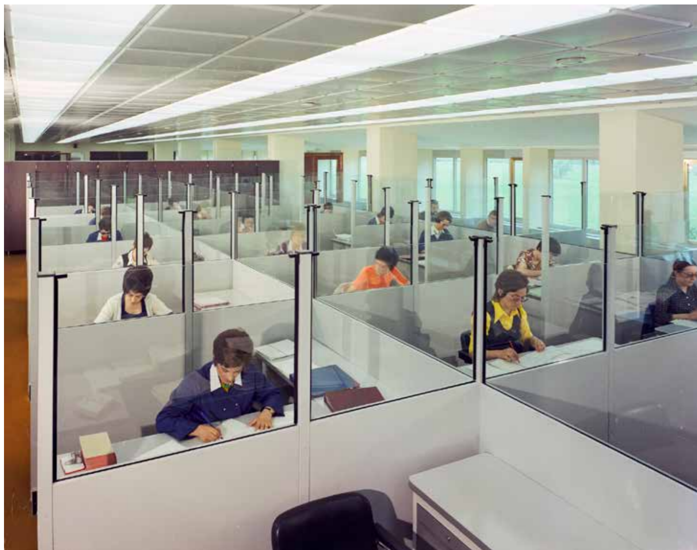
Créations artistiques Heurtier, Société d'assurances MAAF, bureaux semi-cloisonnés, Rennes, juin 1972

La sélection de photographies présentées privilégie un regard autour de l'univers très fonctionnaliste des bureaux des années 1970, qui lie la présence humaine à l'architecture de ces espaces comme une ode à la modernité.