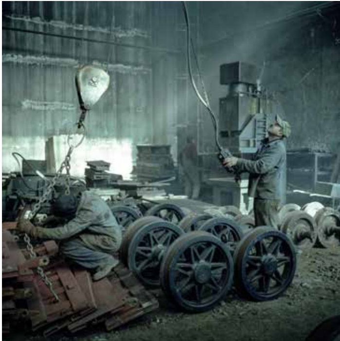
Post Industrial Stories