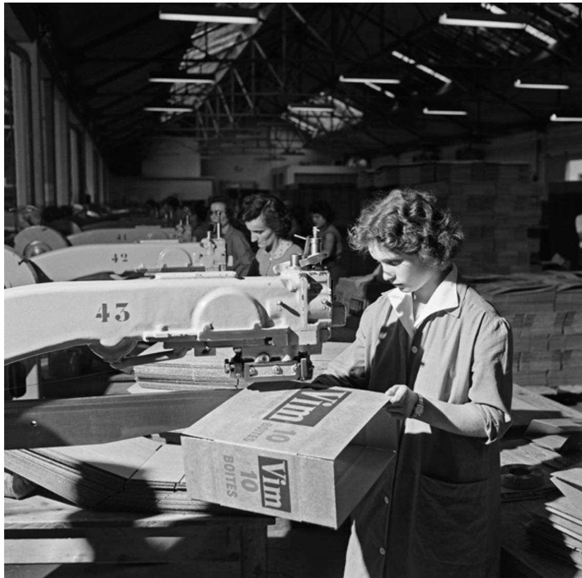
Usine de papeterie et cartonnerie La Rochette - CENPA

Émeric FEHER (1904 Bečej / Serbie - 1966 Paris), photographe d'origine hongroise, arrive en France en 1926. Après un passage ouvrier chez Peugeot puis Citroën, il intègre en 1933 le studio du photographe René Zuber en qualité d'opérateur. Un an plus tard, il rejoint le groupe Alliance Photo fondé par René Zuber et Maria Eisner, l'une des premières agences gérées par des photographes indépendants et réunissant de jeunes photographes. La variété des sujets, des sentiments qui s'expriment dans ce collectif, ainsi que le mode opératoire, en font un photographe humaniste. En 1937, il participe à la célèbre exposition du centenaire de la photographie « Photography 1839-1937 » au Musée d'Art Moderne de New York.