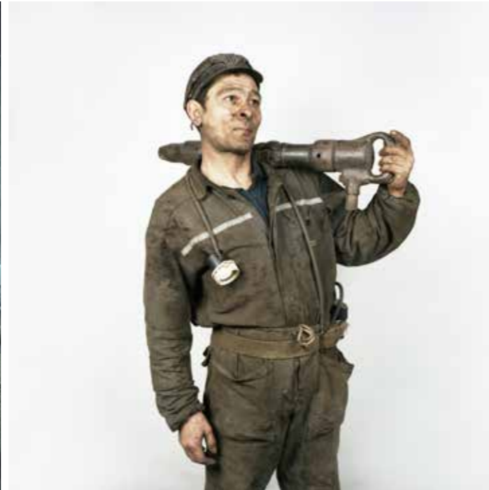
The Last Shift

« Post Industrial Stories » est un projet documentaire à long terme explorant les effets de la désindustrialisation sur les petites villes minières de Roumanie. Le projet vise à capturer l'atmosphère et la vie quotidienne de l'intérieur de ses communautés mono-industrielles.